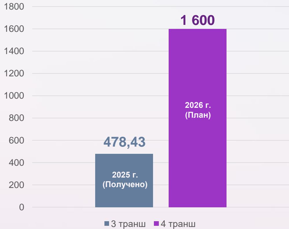
Возмещение затрат по механизму ПП РФ №1119 в млн руб.